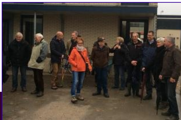
Niet echt een groepsfoto dit jaar, en dan is iedereen er ook nog eens niet

De ovale heuvel wordt elk jaar bewerkt en opnieuw ingezaaid met zo'n 14 verschillende soorten akkerkruiden. In de zomer is het genieten van een bloemenpracht waar honderden solitaire bijen, vlinders, zweefvliegen en andere insecten op afko-