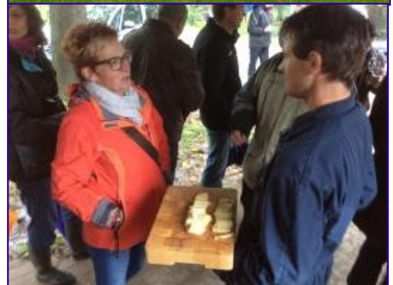
Kaas van eigen melk gaat er goed in bij de gasten